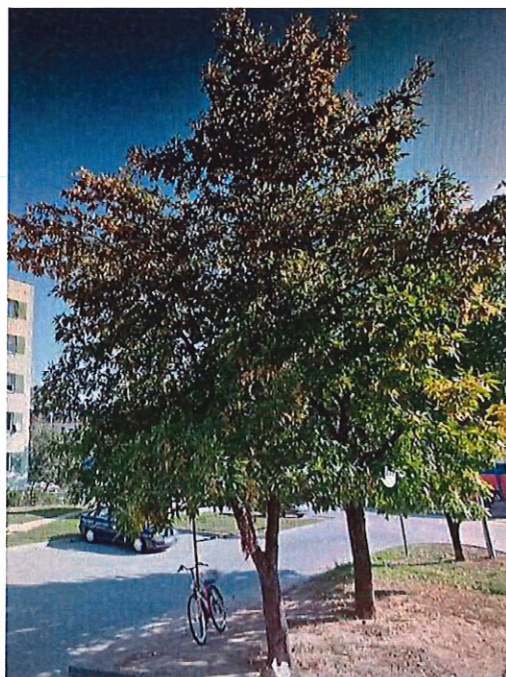
Fot.1.Drzewo przeznaczone do wycinki (przy ul. 19 lutego 6).

Gatunek/odmiana drzewa do nasadzenia zastępczego oraz jego lokalizacja została uzgodniona ze Wspólnotą Mieszkaniową "Nasz Dom" ul. 19 lutego 2,4,6.